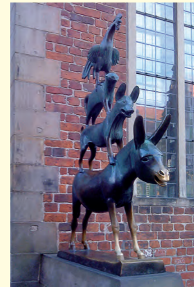
Die Bremer Stadtmusikanten von Gerhard Marcks (1953)