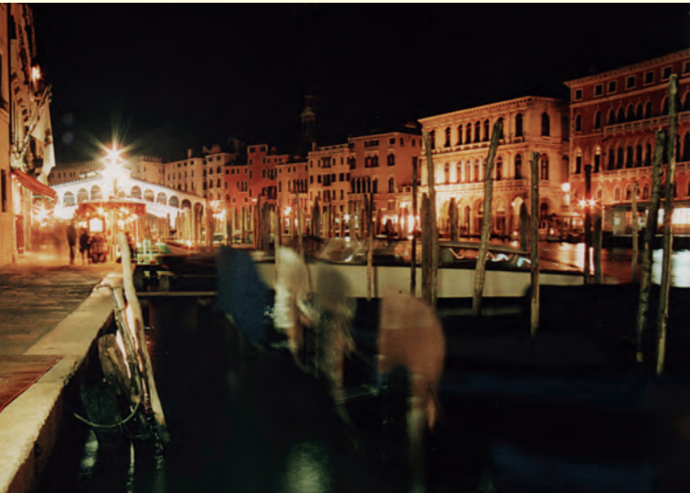
Venedig, Canal Grande